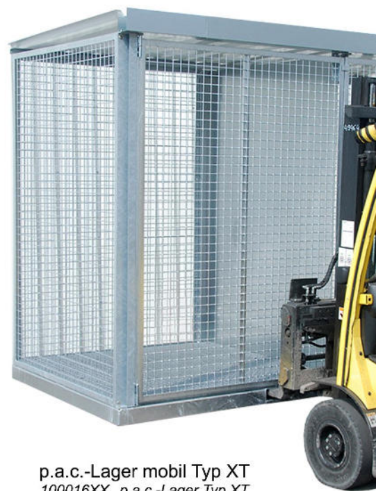
p.a.c.-Lager mobil Typ XT 100016XX p.a.c.-Lager Typ XT

Betriebe und Betriebsstätten sind heute ständig im Wandel. Wer kann heute definitiv sagen wo er welche Lagerkapazitäten für mehrere Jahre benötigt. Daher werden moderne Gasflaschenlagerkäfige nicht mehr an einem Ort fest montiert, sondern können jederzeit an einem anderen Lagerort verlegt werden.