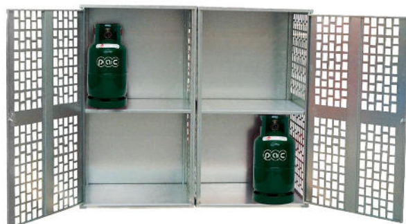
p.a.c.-Lager Typ 8L 10001564 p.a.c.-Lager Typ 8L