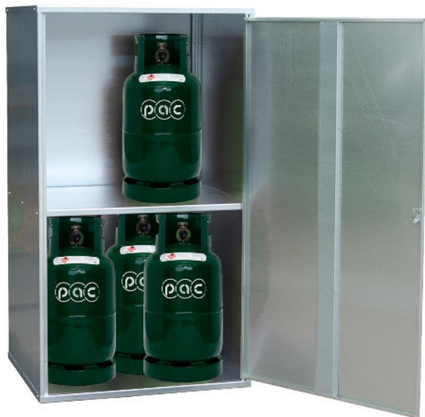
p.a.c.-Lager Typ 7 10001561 p.a.c.-Lager Typ7