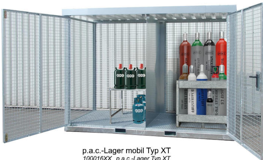
p.a.c.-Lager mobil Typ XT 100016XX p.a.c.-Lager Typ XT

Alle Lagerboxen sind verschließbar und so vor fremden Zugriff geschützt.